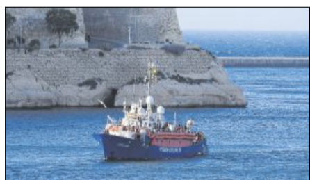
Die Lifeline.

Dabei helfen ihnen ihr Fuß und ihr Schleim. Im Fuß befinden sich eine Menge Muskeln. Damit kann die Schnecke ihre Fußsohle wellenförmig bewegen, um so vorwärts zu kommen. Außerdem haben Schnecken in ihrem Fuß Drüsen. Diese produzieren den Schleim, auf dem die Schnecke vorwärts gleitet. Im Schleim ist unter anderem Eiweiß. Das sorgt dafür, dass der Schleim zäh und klebrig ist. So plumpsen die Schnecken auch bei steilen Touren nicht runter.