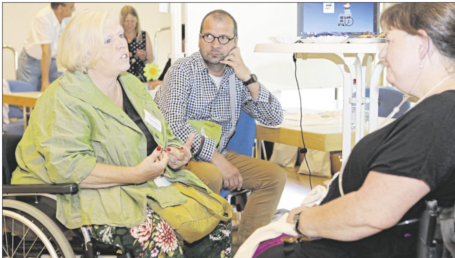
Gehandicapt und trotzdem mittendrin im Leben: Die erste Inklusionsmesse des Rems-Murr-Kreises will zeigen, wie das geht.

Tagelang hatten die Menschen auf dem Schiff gewartet. Am Mittwochabend durften sie dann endlich an Land. In der Stadt Valletta legte das Rettungsschiff Lifeline mit den mehr als 200 Leuten an Bord an. Die Menschen auf dem Schiff stammen aus Afrika. Sie hatten versucht, das Mittelmeer zu überqueren und so nach Europa zu kommen. Das Rettungsboot Lifeline half ihnen. Trotz der Rettung gab es ein Problem: Das Boot durfte zuerst in keinen Hafen einfahren. Denn es war nicht klar, wo die Flüchtlinge hin sollten. Erst als Italien, Frankreich, Irland, Luxemburg, Malta, Belgien, Portugal und die Niederlande erklärten, dass sie die Menschen aufnehmen werden, durfte das Schiff anlegen.