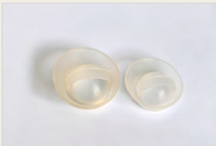
Verhütungskappe Kupa kontraceptive