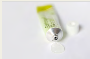
Chemische Verhütungsmittel – Gel Kontraceptivët kimikë – Xheli