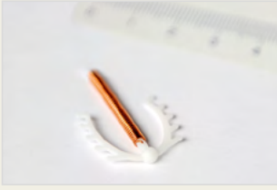
Kupferspirale Spiralja e bakrit