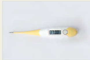
Temperaturmethode – ein Bestandteil der Methoden der Fruchtbarkeitswahrnehmung Metoda e temperaturës - një pjesë e metodave të perceptimit të fertilitetit