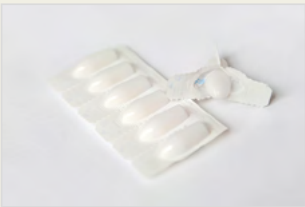
Chemische Verhütungsmittel – Zäpfchen Kontraceptivët kimikë – Supozitor