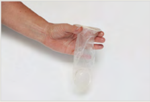
Frauenkondom Prezervativi për gratë