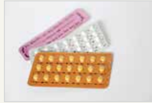
Die Pille – „kombinierte Pille“ La pilule