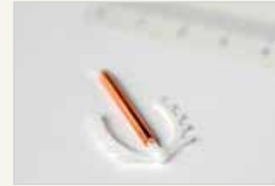
Kupferspirale Le stérilet en cuivre