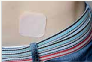
Verhütungspflaster Le patch contraceptif