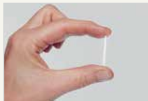
Hormonimplantat L'implant aux hormones