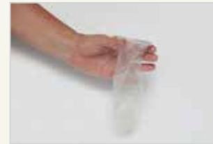
Frauenkondom Le préservatif féminin