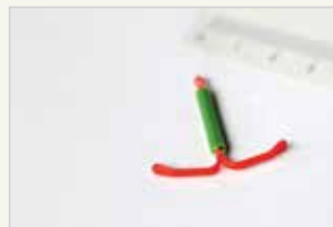
Hormonspirale Le stérilet