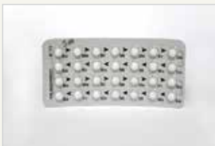
Minipille La minipilule