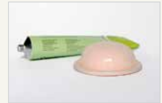
Diaphragma Le diaphragme