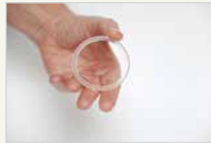
Verhütungsring L'anneau vaginal