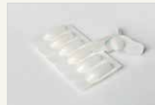
Chemische Verhütungsmittel – Zäpfchen Moyen de contraception chimique – le suppositoire