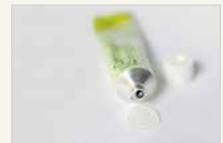
Chemische Verhütungsmittel – Gel Moyen de contraception chimique – gel