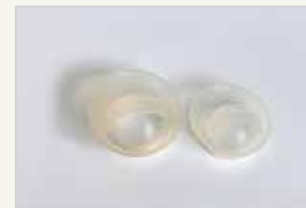
Verhütungskappe Le capuchon cervical