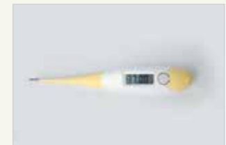
Temperaturmethode – ein Bestandteil der Methoden der Fruchtbarkeitswahrnehmung La méthode de la température – fait partie de la contraception naturelle