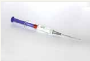
Dreimonatsspritze Le contraceptif injectable trimestriel