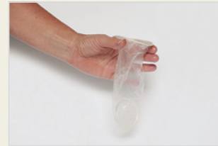
Frauenkondom ናይ ደቀንስትዮ ኮንዶም