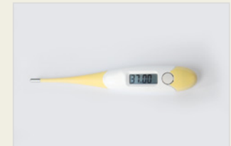
Temperaturmethode – ein Bestandteil der Methoden der Fruchtbarkeitswahrnehmung ረስናዊ አገባብ – ካልእ ናይ ፍርያምነት ኣፍልጦ አገባብ