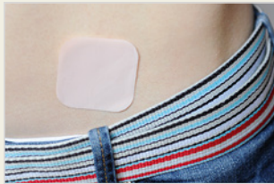
Verhütungspflaster ብጋፕ ገግባር ምክልካል ጥንሲ