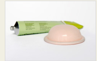
Diaphragma ኣብ ማህጸን ገዛቲ ዲያናሬም