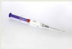
Dreimonatsspritze ናይ ዲፖ ፕሮቬራ መርፍእ ተወጊእካ ገግባር ምክልካል ጥንሲ