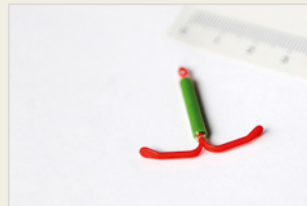
Hormonspirale ናይ ኣይ.ዩ.ዲ.ሆርሞናዊ መከላኸሊ ጥንሲ