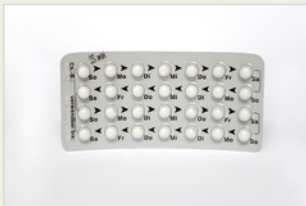
Minipille ሚኒፒል (ንእሹቶይ ከኒና)