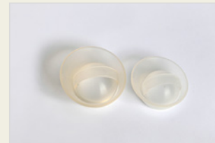
Verhütungskappe ናይ ካፕ መከላኸሊ ጥንሲ