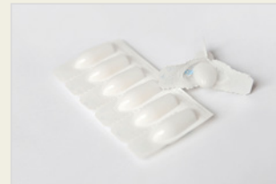
Chemische Verhütungsmittel – Zäpfchen ስነ ቀመማዊ መከላኸሊ ጥንሲ – ኣብ ማህጸን ወይ መገመጫ ገዛቲ