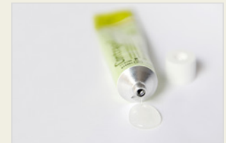
Chemische Verhütungsmittel – Gel ስነ ቀመማዊ መከላኸሊ ጥንሲ-ጅል