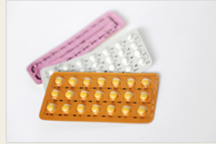
Die Pille – „kombinierte Pille“ እቲ ከኒና ምክትወሃሃደ ከኒናፍ እዩ