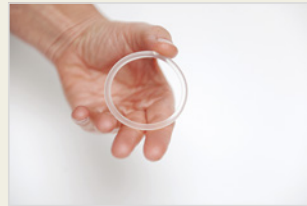
Verhütungsring ናይ ቀለቤት መከላኸሊ ጥንሲ