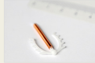
Kupferspirale ኮፐር ኣይ ዩ ዲ