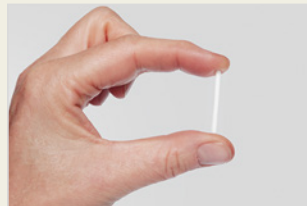
Hormonimplantat ሆርሞን ብምስግጋር ገግባር መከላኸሊ ጥንሲ