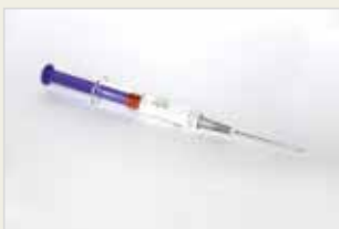
Dreimonatsspritze Derziyên Sêmehî