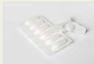
Chemische Verhütungsmittel – Zäpfchen Amora Kîmyayî ya Pêşilêgirtina ji Ducanîbûnê – Şiyaf