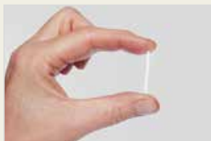
Hormonimplantat Îpelmênta Hormonî