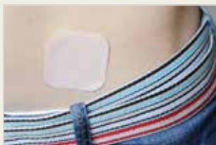
Verhütungspflaster Zeliqoka Pêşilêgirtina ji Ducanîbûnê