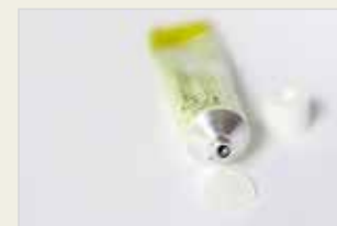
Chemische Verhütungsmittel – Gel Amora Kîmyayî ya Pêşilêgirtina ji Ducanîbûnê – Jêle