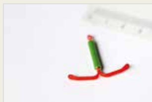
Hormonspirale Spirala (IUD) Hormonî