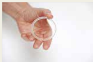
Verhütungsring Xelesa Pêşilêgirtina ji Ducanîbûnê