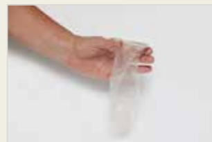
Frauenkondom Kandoma Jinan