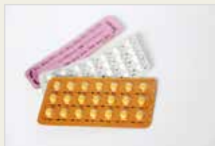
Die Pille – „kombinierte Pille“ Heb – "hebên Hevedudanî"