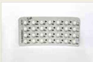
Minipille Hebên Mini Pîl (Şîrdayîn)