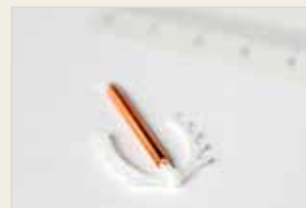
Kupferspirale Spirala (IUD) Mîsî