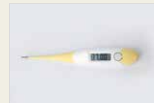
Temperaturmethode – ein Bestandteil der Methoden der Fruchtbarkeits- wahrnehmung Rêbaza germahiya leşî