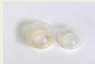
Verhütungskappe Kumika Malzarokê