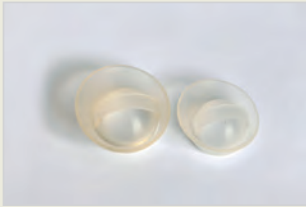
Verhütungskappe کلاه جلو گیری