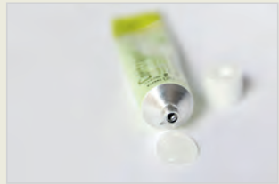
Chemische Verhütungsmittel – Gel مواد کیمیایی جلو گیری حاملگی – جل