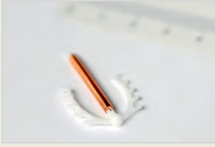
Kupferspirale مارپیچ مسی