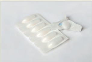
Chemische Verhütungsmittel – Zäpfchen مواد کیمیایی جلو گیری حاملگی – شیاف