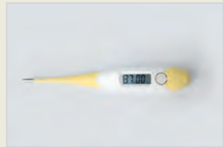
Temperaturmethode – ein Bestandteil der Methoden der Fruchtbarkeitswahrnehmung را های فهمیدن حامل خیزی حاملگی – دیدن درجه حرارت