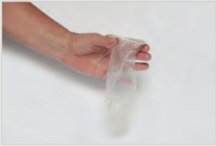
Frauenkondom کاندوم زنانه