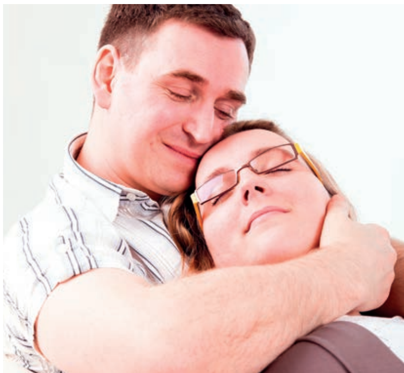
Paare mit unerfülltem Kinderwunsch erleben eine starke psychische Belastung.