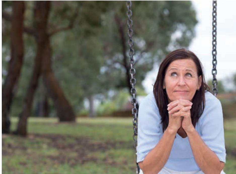
„Kinder? Der Wunsch ist einfach nie entstanden!“

nig Förderung und Aufmerksamkeit bekommen.