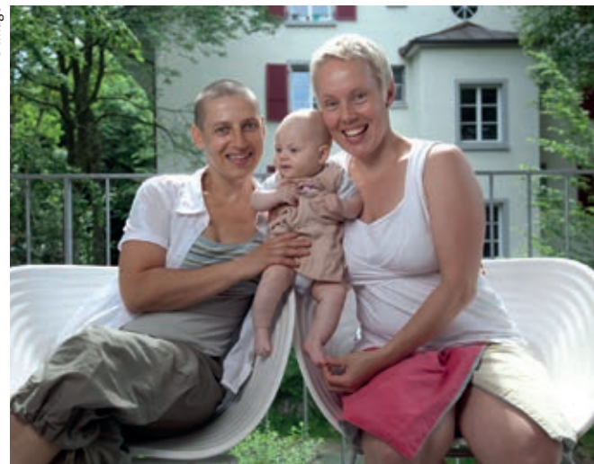
Lesbische Frauen erfüllen sich häufig ihren Kinderwunsch mit Samenspendern.

Alleinstehenden geplant werden oder bereits bei ihnen leben. Diese Kinder sind alle Wunsch Kinder, die laut einer durch das Bundesministerium für Justiz beauftragte und von Martina Rupp durchgeführte Studie zur „Lebenssituation von Kindern in Eingetragenen Lebenspartnerschaften“ aus dem Jahr 2009 alle Chancen und Möglichkeiten haben, in einem liebevollen Umfeld tolerante und beziehungs fähige Menschen zu werden. Laut Studie kommt es nicht auf das Geschlecht der Eltern und die Familienkonstellation an bei der Erziehung von Kindern sondern auf die Beziehungsqualität in der Familie. Regenbogenfamilie ist nicht gleich Regenbogenfamilie. In ihren Entste-