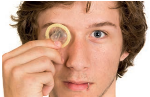
Konsequente Verhütung fällt leichter, wenn kein ambivalenter Kinderwunsch vorhanden ist.

zusetzen, und damit die andere Seite selbstbestimmter Elternschaft.