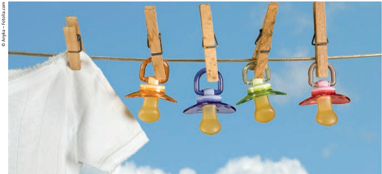
Wichtig ist, wie die biologische, rechtliche und soziale Elternschaft gelebt wird.

hungsdynamiken, ihren rechtlichen Absicherungen und in der gesellschaftlichen Wahrnehmung können sie sich erheblich voneinander unterscheiden. Einzig die Tatsache, dass mindestens ein Elternteil der Gruppe der Lesben, Schwulen, Bisexuellen und Transidenten angehört, kann der gemeinsame Nenner sein. Wenn diese Menschen alleine oder als Paar einen Kinderwunsch haben, stehen sie oft vor vielen Fragen und der Herausforderung, wie sie diesen Kinderwunsch umsetzen können und wollen. Das Projekt Regenbogenfamilien des Lesben- und Schwulenverbandes Berlin-Brandenburg (LSVD) mit seinem im März 2013 gegründeten Regenbogenfamilienzentrum bietet in Berlin Schöneberg eine deutschlandweit einzigartige Anlauf- und Beratungsstelle.