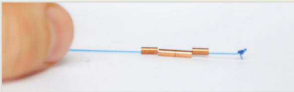
Kupfer-Kette mit vier Zylindern

Die Kupfer-Kette besteht aus einem Kunststofffaden, auf dem vier bzw. sechs kleine Kupferzylinder aufgezogen sind. Sie ist zwei bzw. drei Zentimeter lang. Der Faden trägt an einem Ende einen Knoten, der für die Ultraschallkontrollen mit einem Mini-Clip aus Edelstahl markiert ist.