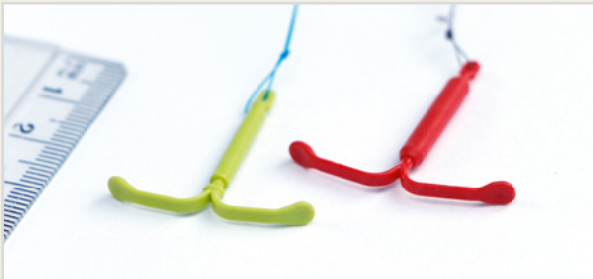
Hormon-Spirale in zwei Größen (Demo – das Original ist weiß)

Die Hormon-Spiralen sind sehr sicher. Mit der größeren Hormon-Spirale werden im ersten Jahr zwei von 1.000 Frauen schwanger, bei der kleineren sind es vier von 1.000 Frauen und bei der Kyleena® ungefähr 3 von 1.000 Frauen. Ab dem zweiten Jahr sind alle Hormon-Spiralen noch sicherer – etwa so sicher wie eine Sterilisation. Eine Eileiter-Schwangerschaft wird nicht ganz so sicher verhindert wie eine Schwangerschaft in der Gebärmutterhöhle.