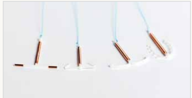
Verschiedene Formen der Kupfer-Spirale

Die Abkürzung IUP steht für Intra-Uterin-Pessar. Die in Deutschland verwendeten Kupfer-Spiralen gibt es in vier verschiedenen Formen und mehreren Größen. Der Längsarm ist mit Kupferdraht umwickelt. Die zwei kleineren Querarme sind je nach Modell verschieden gebogen. Eine Sonderform ist die Kupfer-Kette (siehe S. 16).