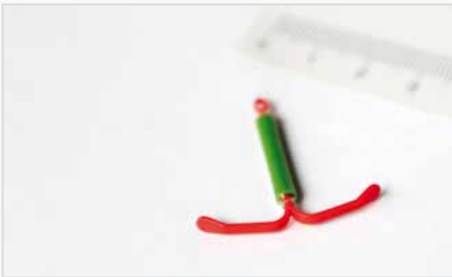
Hormon-Spirale – größeres Modell (Demo – das Original ist weiss)

Die Vorbereitungen und das Einlegen erfolgen genauso wie bei der Kupfer-Spirale (siehe Seite 5).